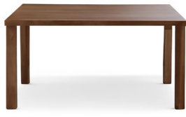
ダイニングテーブル