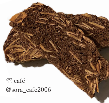
空 café @sora_cafe2006

Open 10:00 Close 16:00 tbc ハウジングステーション 仙台駅東口