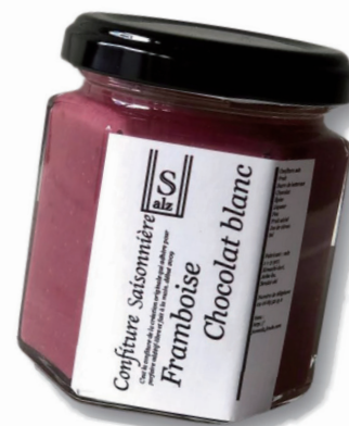
創作ジャム専門店 salz @jamsalz