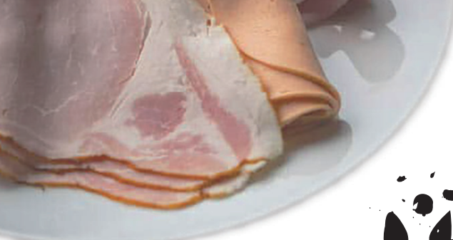
アトリエ・ドゥ・ジャンボンメゾン @jambon.maison_official