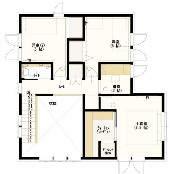
※図面はイメージとなります

(株)一条工務店仙台 仙台榴ヶ岡展示場 〒983-0852 仙台市宮城野区榴岡3丁目1-25 TBCハウジングステーション内