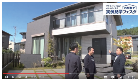
プラス・マイナスがバスでめぐる! わが家で実例見学フェスタ