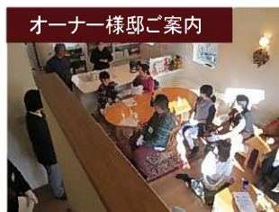
オーナー様邸ご案内